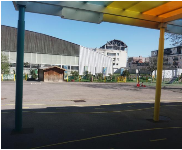
Le jardin potager, ses fleurs et ses jolis panneaux de mosaïques