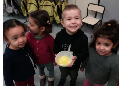
Nous avons comparé le beurre solide et dur avec le beurre mou (voire un peu liquide !)